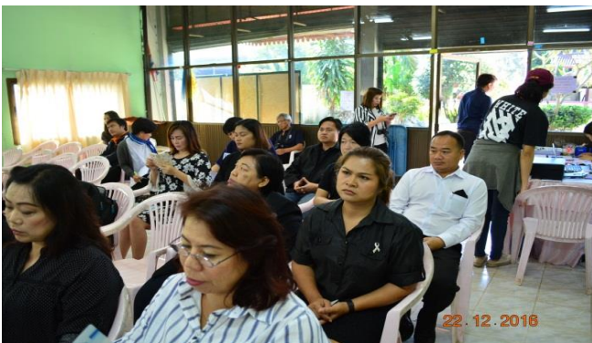
ผู้เข้าร่วมการประชุม