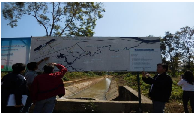
พื้นที่การส่งน้ำ