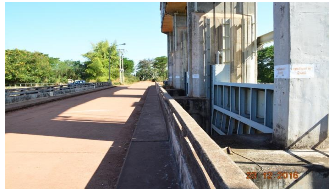
ประตูระบายน้ำห้วยหลวง