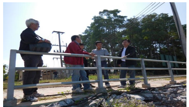
รับฟังข้อมูลโครงการ