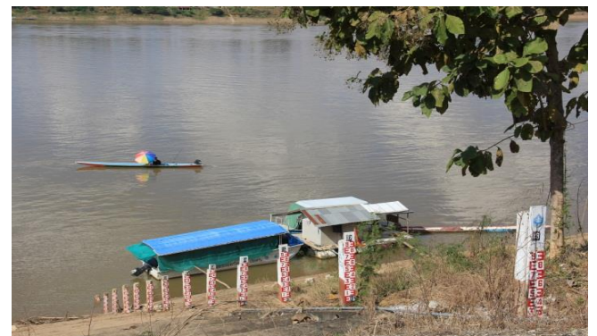
เครื่องมือวัดระดับน้ำถาวร