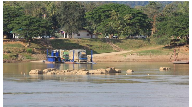
จุดขึ้น-ลงเรือปากชมพื้นที่เสี่ยงจากการเกิดอุทกภัย