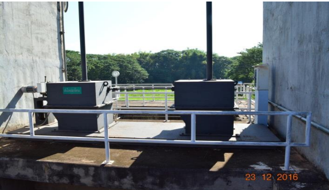
บันไดปลาโจนในโครงการห้วยหลวง