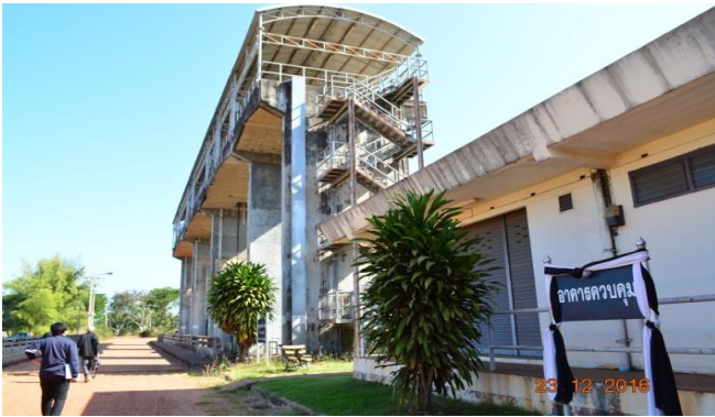
โครงการชลประทานห้วยหลวง กรมชลประทาน