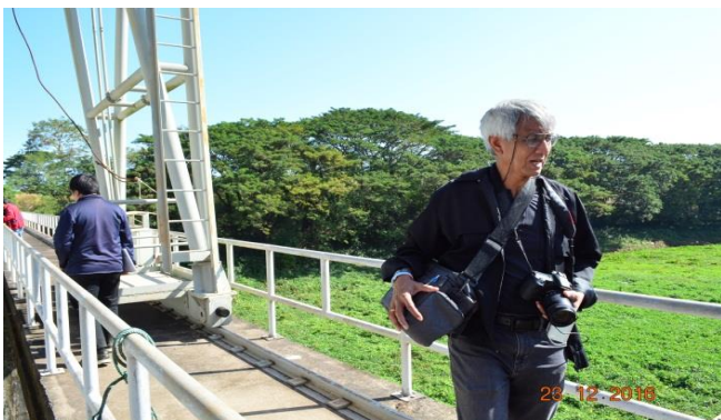
ประตูระบายน้ำห้วยหลวง