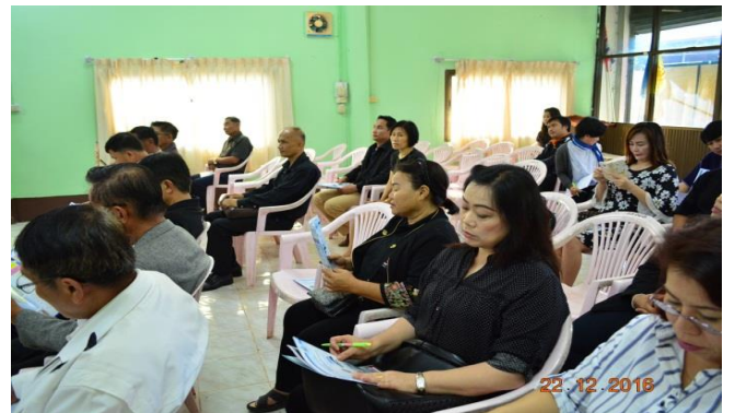
ผู้เข้าร่วมการประชุม