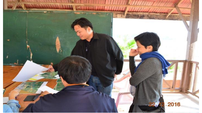
การวางแผนงานปฏิบัติงาน