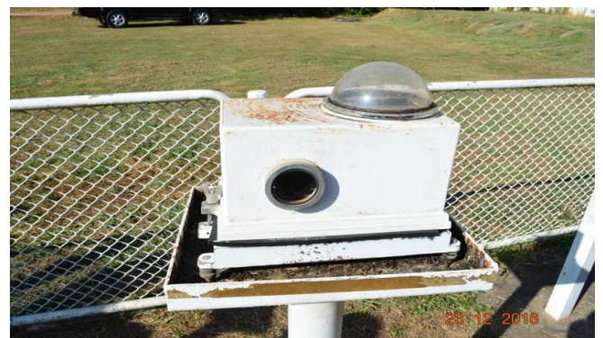
สถานีอุตุนิยมวิทยา