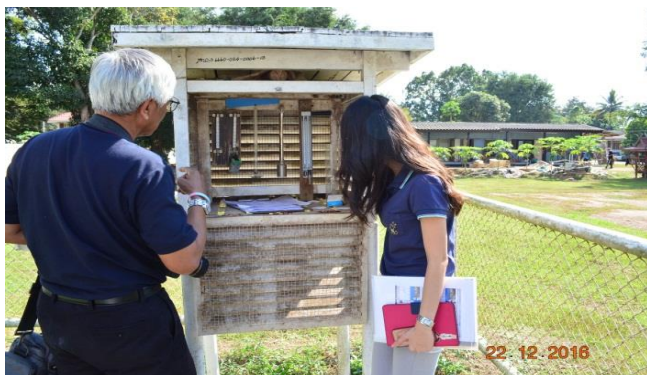
สถานีอุตุนิคมวิทยา