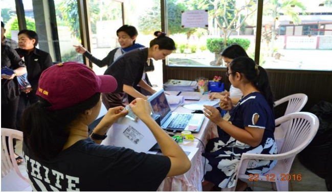
การลงทะเบียนผู้เข้าร่วมการประชุม