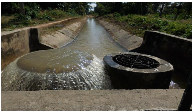
คลองส่งน้ำโครงการ