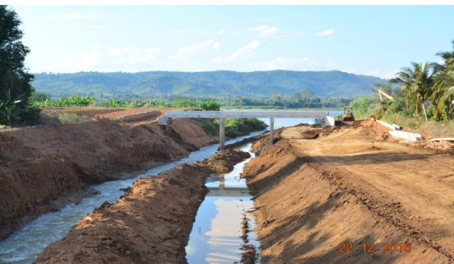
โครงการก่อสร้างฝายสงวนดำเนินการ โดยกรมทรัพยากรน้ำ