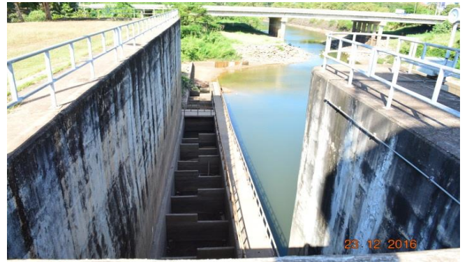
บันไดปลาโจนในโครงการห้วยหลวง