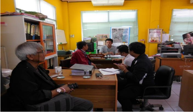
รับทราบข้อมูลการดำเนินโครงการ