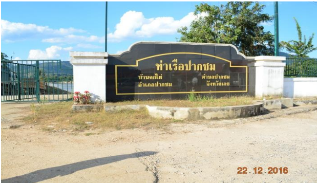
ท่าเรือปากชม บ.คอกไฟ ต.ปากชม อ.ปากชม จ.เลย