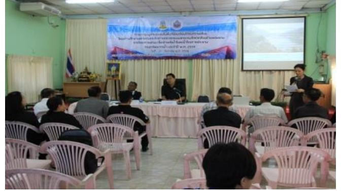
ผู้เข้าร่วมการประชุม