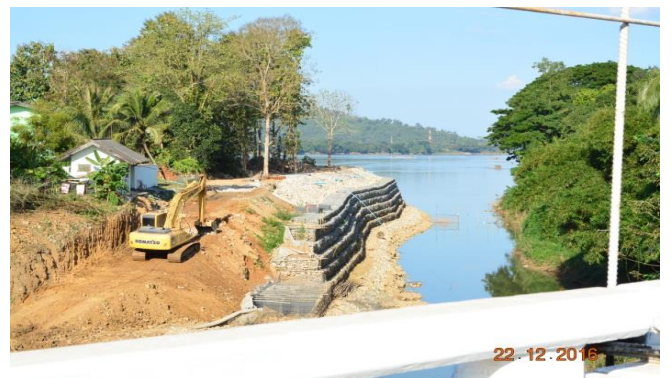
โครงการก่อสร้างฝายสงวนดำเนินการ โดยกรมทรัพยากรน้ำ