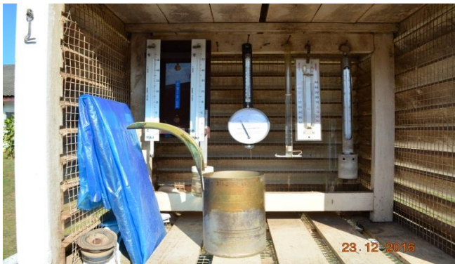
สถานีอุตุนิยมวิทยา