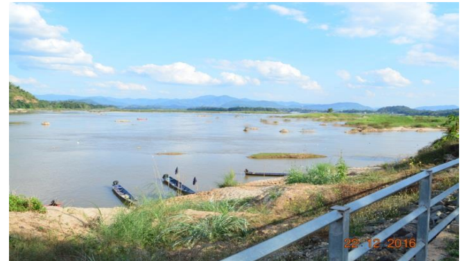
สภาพลำน้ำแม่น้ำโขงด้านท้ายน้ำบริเวณท่าเรือปากชม