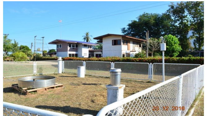
สถานีอุตุนิยมวิทยา