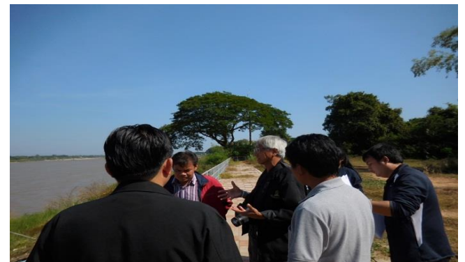
รับฟังข้อมูลโครงการ