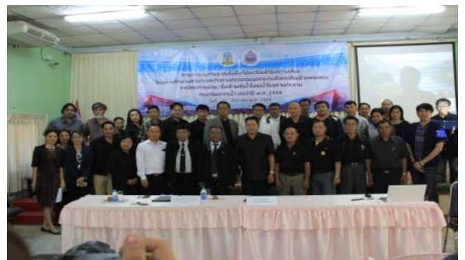
ภายหลังเสร็จสิ้นการประชุม