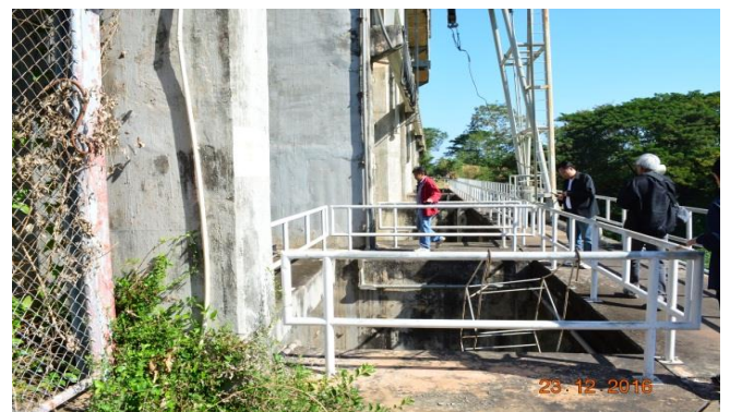
ประตูระบายน้ำห้วยหลวง