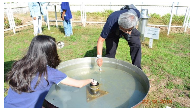
สถานีอุตุนิคมวิทยา