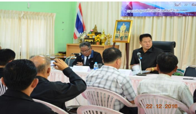
ผู้เข้าร่วมการประชุม