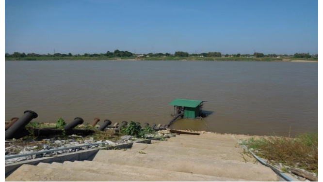
สถานีสูบน้ำในแม่น้ำโขง