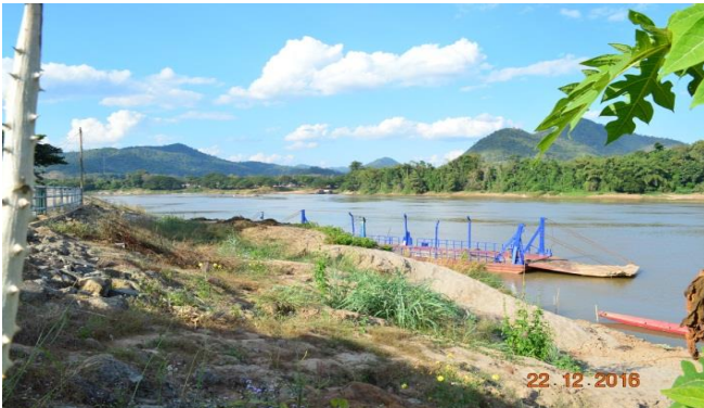
สภาพลำน้ำแม่น้ำโขงด้านเหนือน้ำบริเวณท่าเรือปากชม