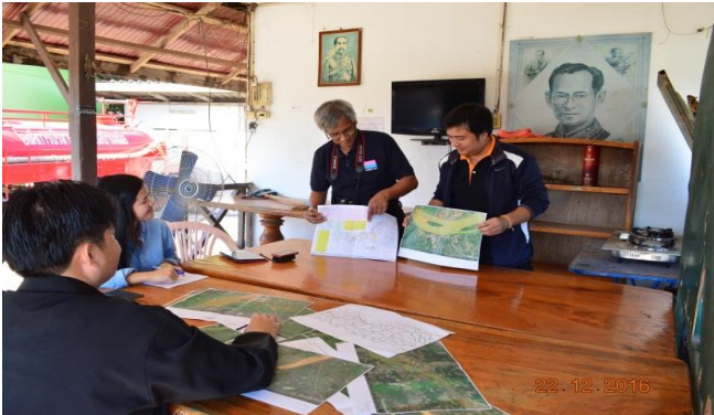
การวางแผนงานปฏิบัติงาน