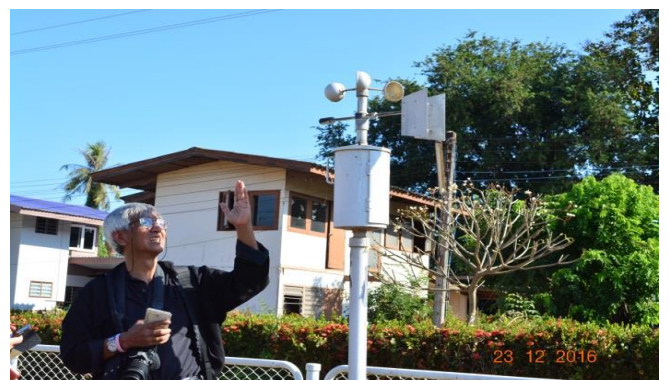
สถานีอุตุนิยมวิทยา