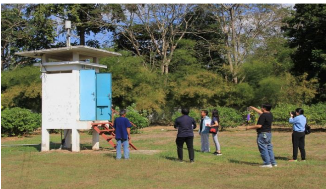
สถานีโทรมาตร