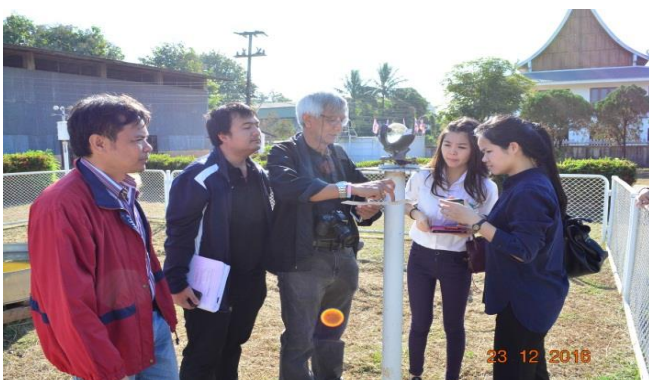
สถานีอุตุนิยมวิทยา